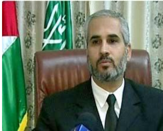
Le porte-parole du Hamas Fawzi Barhoum : "'le lobby juif' aux Etats-Unis est derrière l'économie américaine" (Site Internet Palestine-info)

Terrorisme et antisémitisme : le porte-parole du Hamas accuse les Juifs de la crise financière qui frappe l'Amérique. Dans l'esprit de l'antisémitisme classique, les Juifs sont représentés comme étant responsables de toutes les crises du monde. L'incitation antisémite fait partie de la propagande méthodique du Hamas qui recourt notamment aux mythes des Protocoles des Sages de Sion.